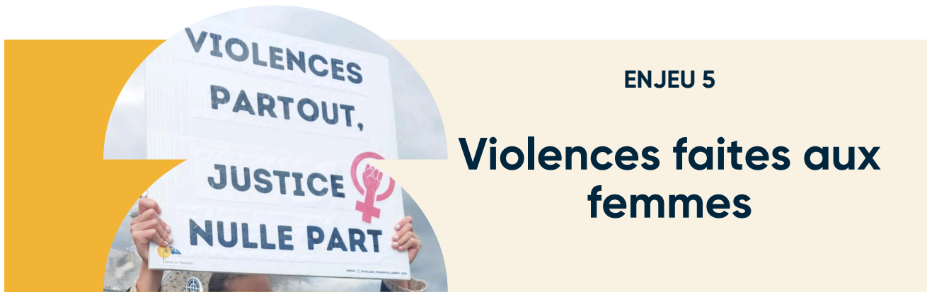
Photo 6. Pancarte lors d'un rassemblement à Bonaventure dénonçant le vingtième féminicide de 2024, 2024

La région de la Gaspésie et des Îles-de-la-Madeleine est l'une des plus touchées en matière de violence. Les femmes sont victimes en plus grand nombre que les hommes de violences sexuelles et conjugales, de même que de harcèlement [136].