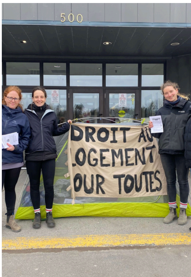
Photo 4. Travailleuses (TCF-GÎM), lors d'un rassemblement sur le droit au logement, 2024

Le coût du logement représente la charge la plus importante des ménages à faible revenu [106]. En Gaspésie-Îles-de-la-Madeleine, 67,1 % des femmes sont propriétaires contre 82,0 % des hommes et plus du tiers des femmes à la tête d'un ménage sont locataires contre seulement 17,8 % des hommes dans cette situation [107]. Dans la région, ce sont les personnes locataires (11,2 %), et plus particulièrement celles de 55 ans et plus, qui vivent dans un logement inabordable, c'est-à-dire un logement dont les frais représentent 30 % ou plus avant impôt du revenu du ménage [108].