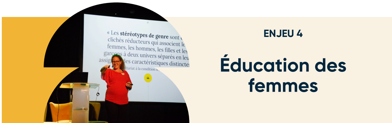
Photo 5. Catherine Cyr Wright (TCF-GÎM), lors d'une conférence sur les stéréotypes de genre en éducation, 2022

Si les femmes de la région ont, tous types de diplômes confondus, un taux de scolarisation supérieur à celui des hommes [125], elles doivent étudier plus longtemps pour obtenir un salaire équivalent. En 2021, les taux de personnes âgées de 25 à 64 ans sans diplôme dans la région étaient de 16,4 % chez les femmes et 24,3 % chez les hommes [126]. Les femmes étaient plus nombreuses à être diplômées d'un collège, d'un cégep ou d'un autre établissement non universitaire (24,4 % chez les femmes et 15,4 % chez les hommes) et à avoir complété au moins un baccalauréat (19,0 % chez les femmes et 10,9 % chez les hommes) [127].