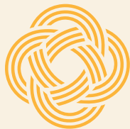
Table de concertation féministe GASPÉSIE • ÎLES-DE-LA-MADELEINE

Les grands enjeux régionaux en condition féminine