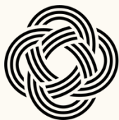
Table de concertation féministe GASPÉSIE · ÎLES-DE-LA-MADELEINE

Ce projet a été financé par le Secrétariat à la condition féminine du Gouvernement du Québec.